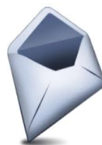
BUSTA PICCOLA DI COLORE BIANCO